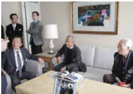
天皇・皇后両陛下もお泊りになった特別室