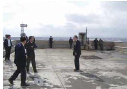
屋上から市街地を展望