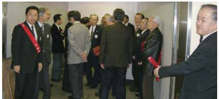
例会場であるANAクラウンプラザホテル千歳を探検