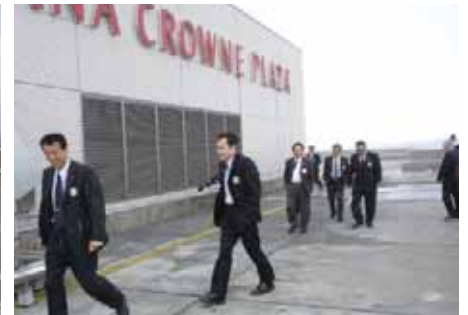
屋上からの見学終了時刻を告げるかのように急に雪「寒い寒い」