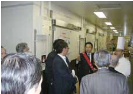
「入るべからずの」厨房も見学