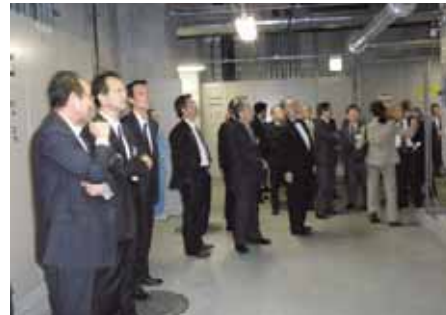
地下のボイラー室