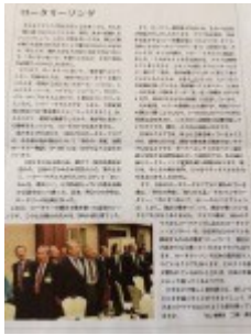
資料1「ロータリーソングの由来」