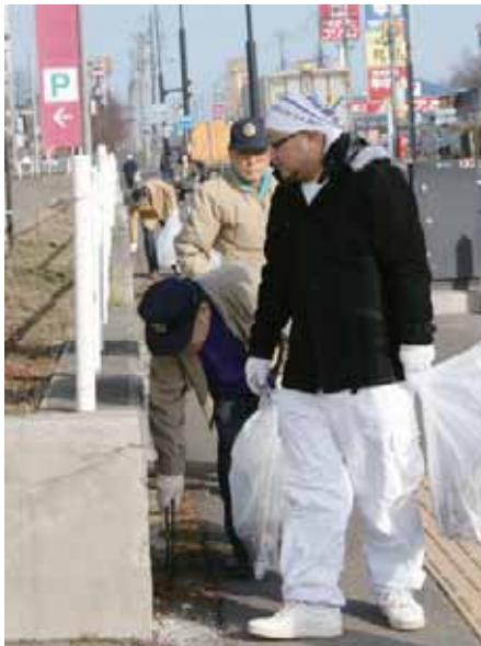
いで立ちもさまざま