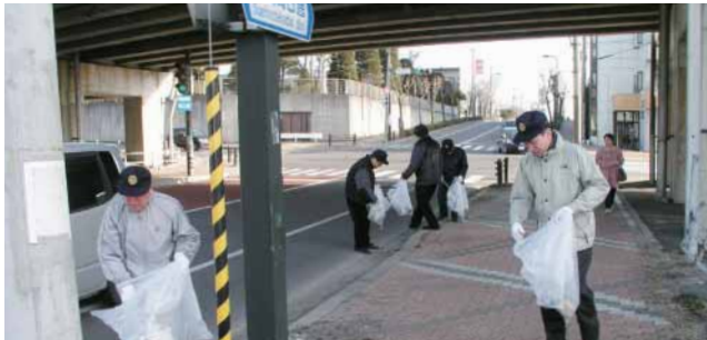
ガード下も念入りに