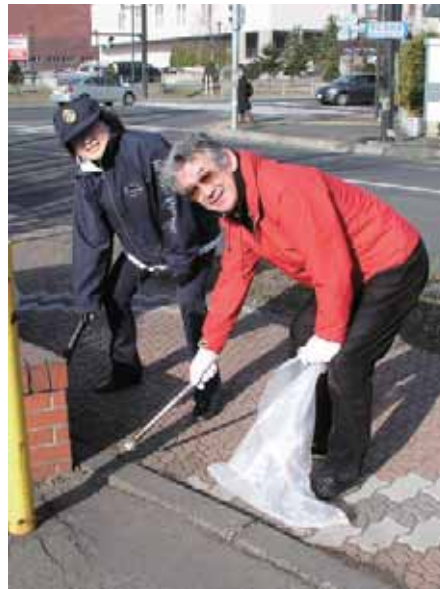
財団委員長と職業奉仕委員長