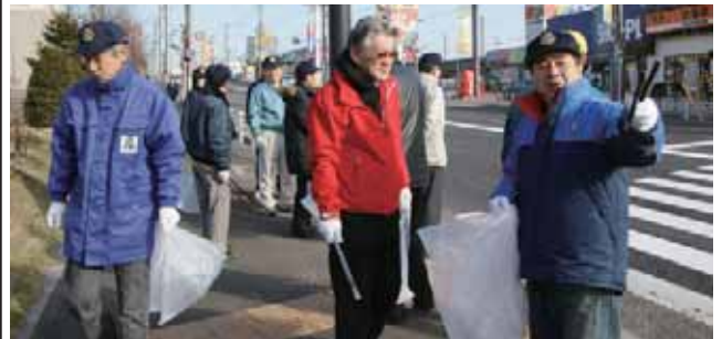
会長と財団委員長が作業の見通しを