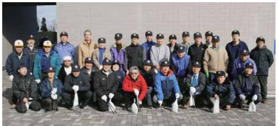
清掃作業を終えて集合