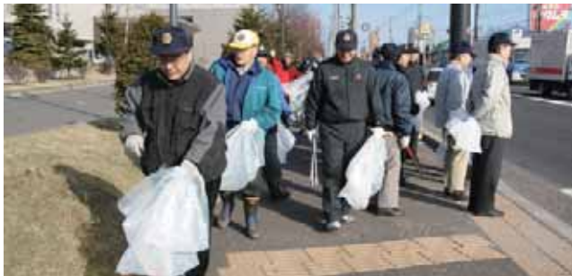
ホテル前から、早速ごみ拾い開始