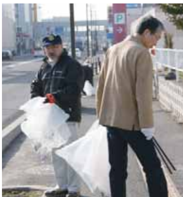
早朝例会で例会場付近の道路を清掃