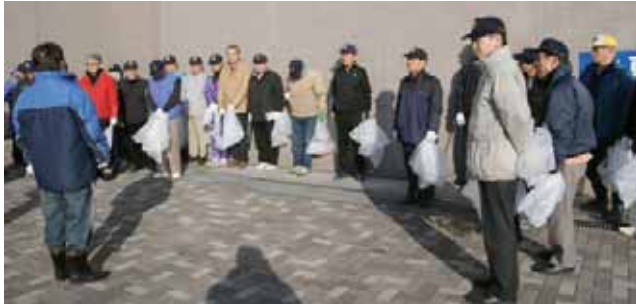
清掃活動の前に会長あいさつを聞く会員