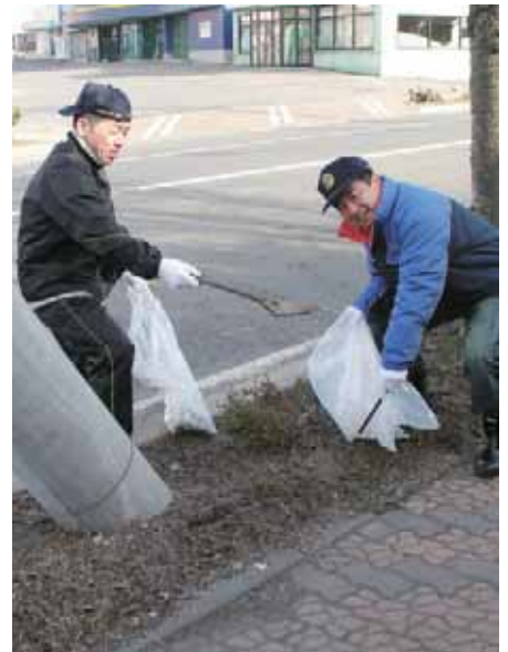
会長と幹事が息合わせて