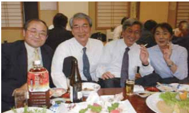
食後の一服は、うまいですねえ