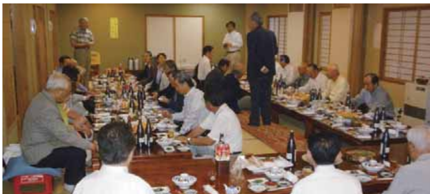
年に一度のお楽しみ、番屋の料理とお酒

6月9日 (火) 年次総会 午後6時から、バルクラシック・リアン (千歳平安閣)