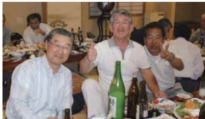
番屋例会で木曜会の疲れを取ってリフレッシュ