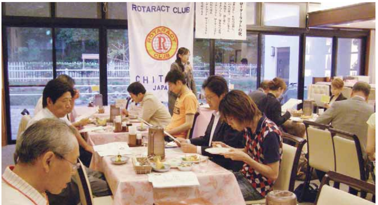
千歳ローターアクトクラブ、2009～2010年度が始動