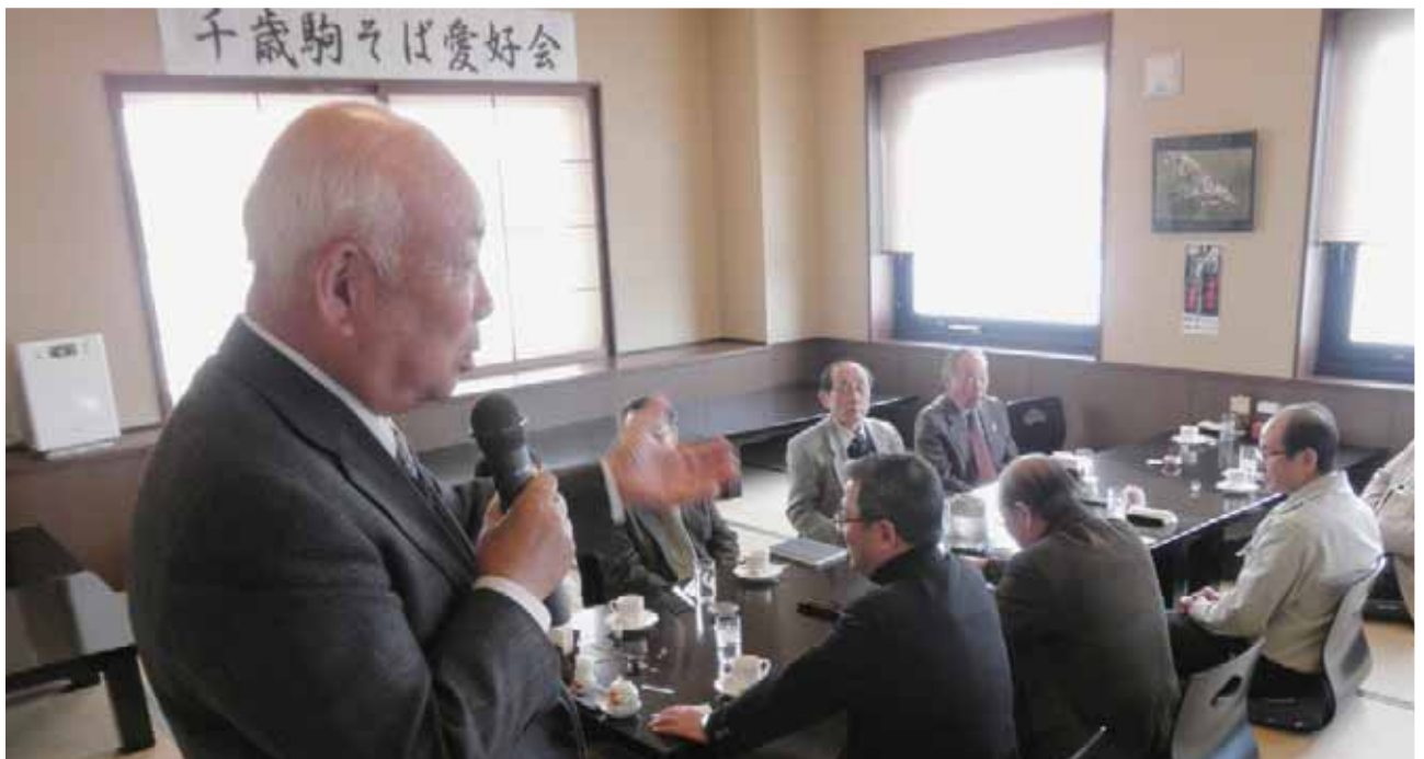
駒そば亭で移動例会 (2月4日)