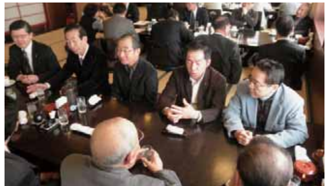
そばを食べ終えて、コーヒーを待っています