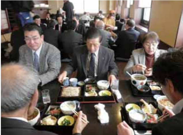
温かいおそばと冷たいおそば