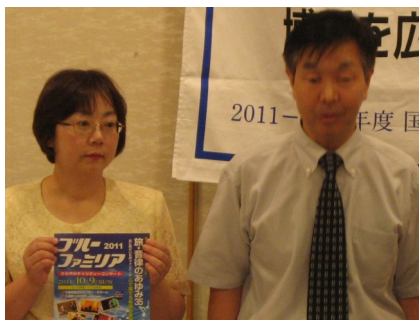
奥様（左）と目黒代表（右）

例会の貴重なお時間をいただきありがとうございます。ブルーファミリアは35年前にこの千歳で誕生した音楽バンドで、メンバー全員が視覚障がいを持っているバンドです。35年の歴史とともに全国へ活動の輪が広がり、障がい者自らが社会へ恩返しをしようとの精神の下、心を一つにして頑張っております。バンドメンバーは15名で、平成9年からは視覚障がい者劇団『睦（むつみ）』の20名が加わり、健常者の応援スタッフも入