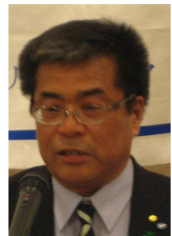
大澤会員も後援会員です