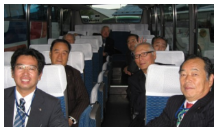
バスで記念懇親会場のグランドパーク小樽へ移動