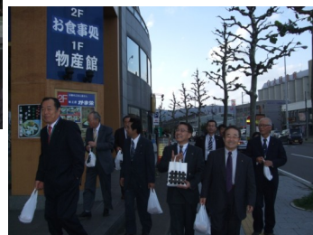
途中で消費拡大・地域に貢献