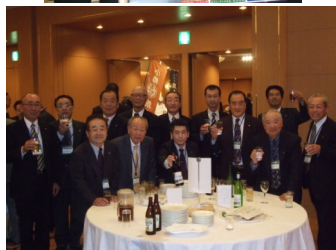
記念祝賀会で、皆で乾杯!!