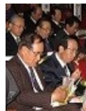
小樽市民会館での昼食