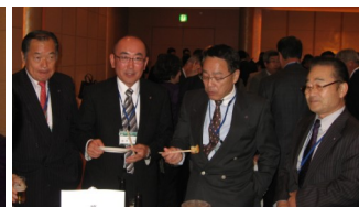
小樽政寿司ほか美味しい料理にニコリ

千歳ロータリークラブホームページ http://www.chitose-rc.jp