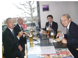
ビールと揚げ立てのかまぼこは美味しいゾ