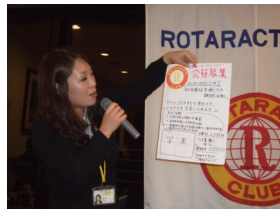
会員募集オリジナルポスター作成、作品発表