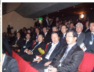
早朝から小樽市民会館に集めた千歳RCの皆さん