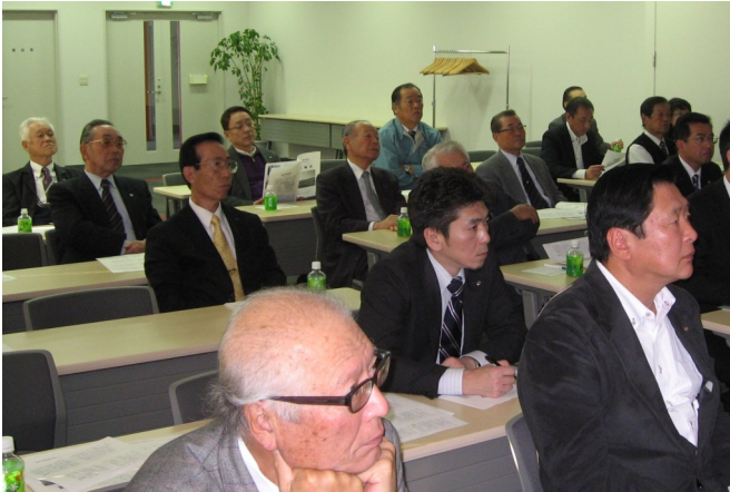
熱心に耳を傾けるロータリアンの面々