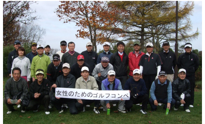
スタート前、少々、寒い中で緊張!!