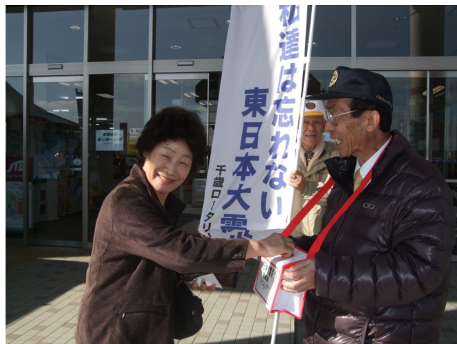
買い物客も快く募金(^^)／