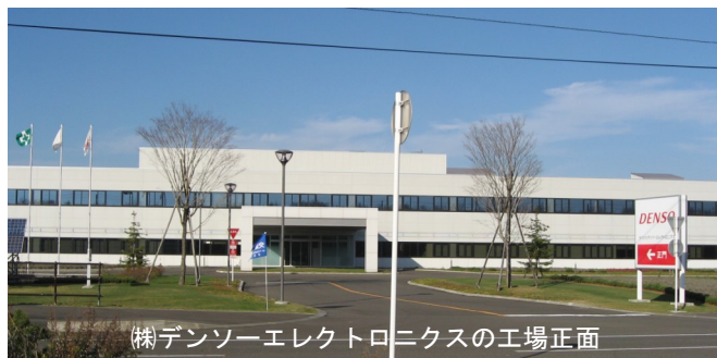
(株)デンソーエレクトロニクスの工場正面

柱・梁などを極力減らした効率的なレイアウト及び埃を徹底的に除去するクリーンな工場