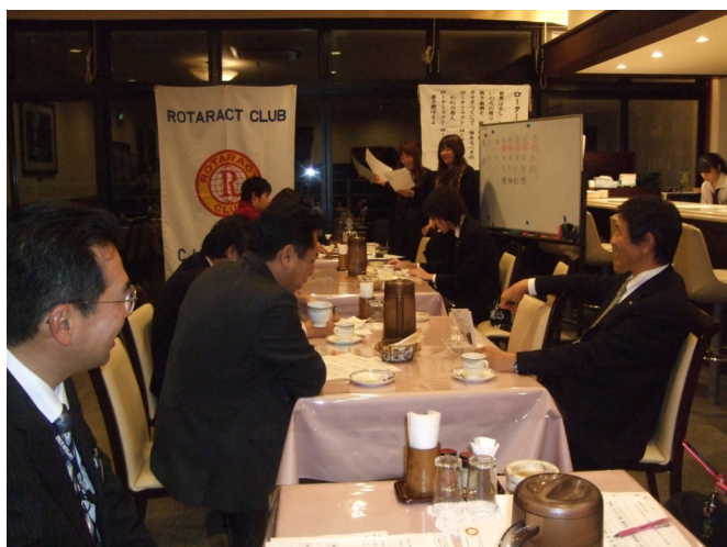
ロータリアンも難問に苦戦!!

クラブ奉仕・専門知識開発委員会担当で、漢字の書き取りをはじめ、難読漢字読み取り、熟語を完成させる問題など「頭を使おう！漢字テスト」が行われ、難問に「読めず・書けず」と苦戦をする姿が見られました。