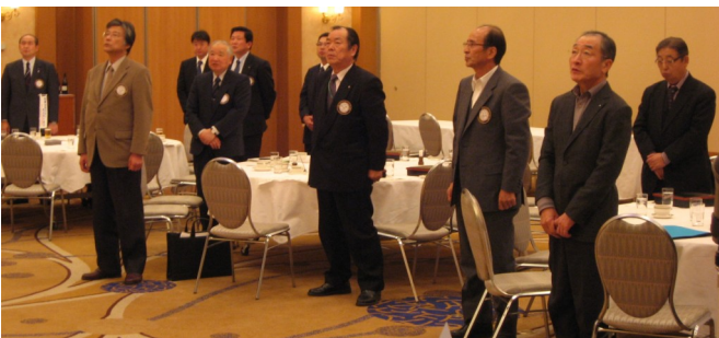
ロータリーソング斉唱に続き四つのテストの唱和