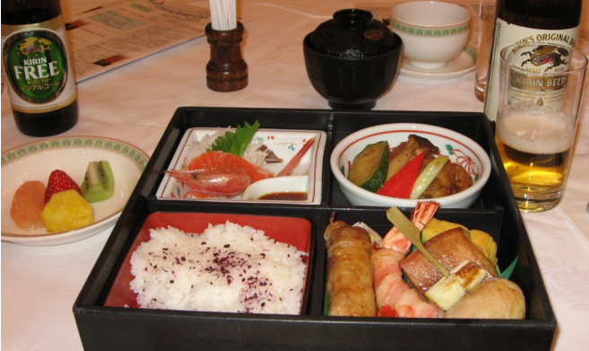
本日の美味しいメニュー