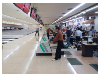
真剣な表情の五十嵐会員