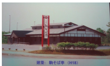
武石忠俊PC思い入れの “駒そば亭” (H18年)