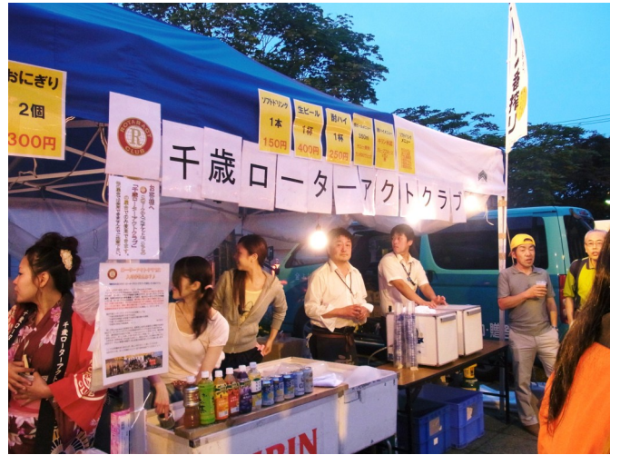
ローターアクト頑張ってます！