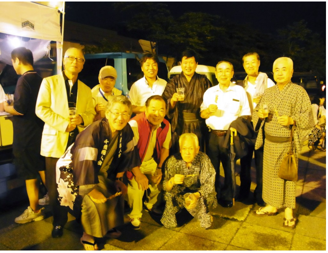
ごく一部の集合写真・・・ロータリーに乾杯(^_^)

千歳市民夏まつりの最大のイベントである千歳市民盆踊り大会にご参加をいただきありがとうございます。今夜の盆踊りを盛り上げるためにも大いに飲み、語り合しましょう。乾杯！！