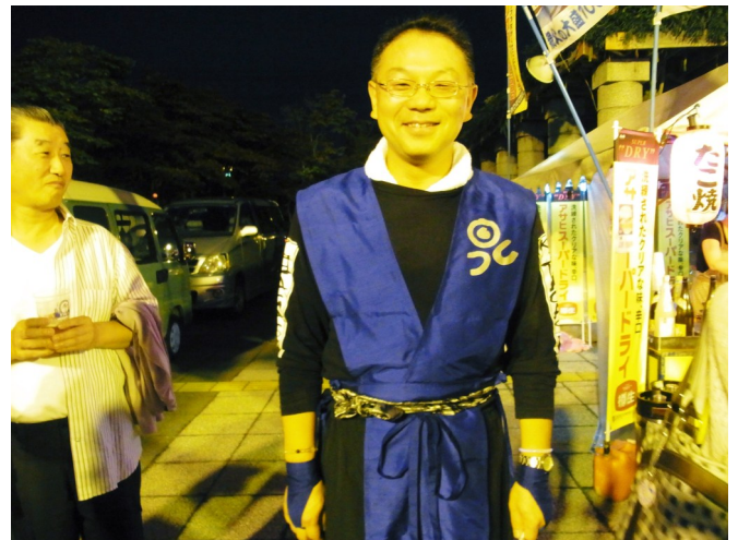
北ガスチーム 金沢会員 踊ってきます！