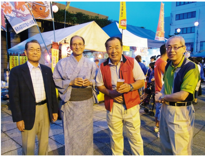
例会前にチョット一杯(^_^)v