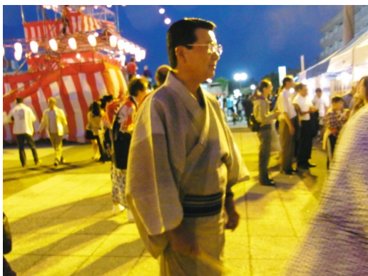
名誉会員 山口市長もご参加