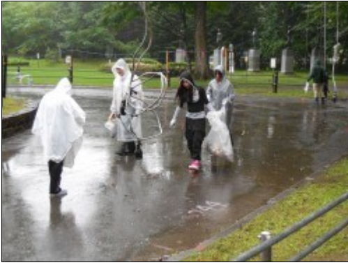
※沢山のボランティアの方々もゴミ拾いをしていました。中には小さな子供さんの姿も見受けられました。