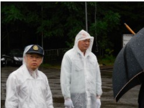
※30分程ゴミ拾いをし、境内前に戻ってきた会員達です。この雨にはさすがに参っている様子・・・。