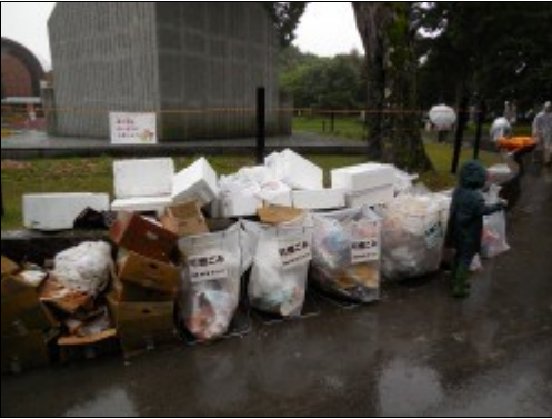
※こちらが集められたゴミの一部です。楽しいお祭りの陰に、こんなにも多くのゴミが出ているのですね・・・。