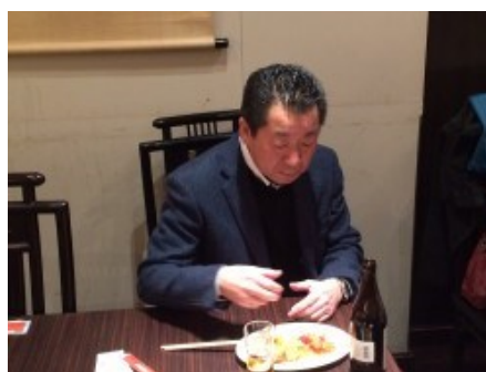
※栗津総支配人、有り難うございました!