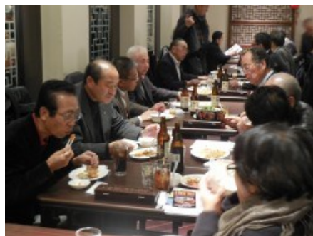
※その後の会員の食事の様様です。

観光業の方が観光客を呼んでくる。今まではそういう形だったのかもしれませんが、今後は観光業以外の方々も確実に訪問されます。製造業や農業など、様々な部分で海外のお客様がご利用になり、そこにお金を費やします。地域全体で活性化していく事が大事です。今日お集まりの皆さまのお力をお借りしながら、千歳の隆盛の為に努力してまいりますのでよろしくお願い致します。