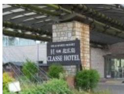
※会場の札幌 北広島クラッセホテルです。