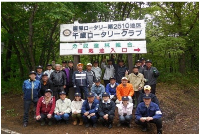
※最後に集合写真を撮り、解散となりました。

余談ですが本日この例会には女性が3人おります。この分収造林の草刈作業にはトイレ等は用意されておりませんので、女性会員はあえて参加しなくても良いというのが私の考えでありましたが、本日は参加して頂いている事が、とても嬉しいです。それでは入口のこの看板前で皆さんと記念写真を撮りたいなと思っております。またここで写真を撮る事でこれから50周年の記念写真に使用して頂ける機会にもなると思います。お帰りには美味しい美味しいお弁当を用意しておりますので持ち帰って下さい。本日は、早朝から誠に有り難うございました。