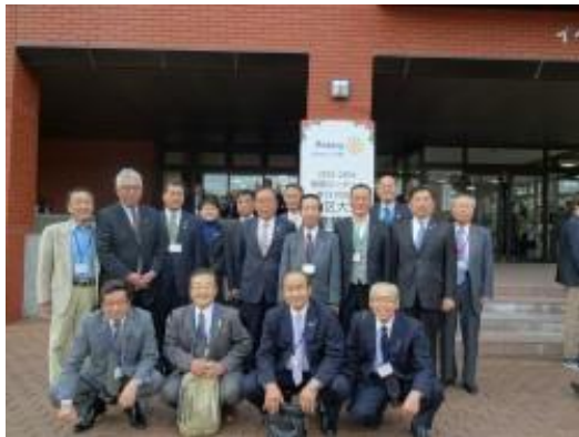
会場入口で記念写真

本会議終了後、まなみーる「岩見沢市民会館」からバスでイベントホール赤れんがに移動して懇親会が行われました。