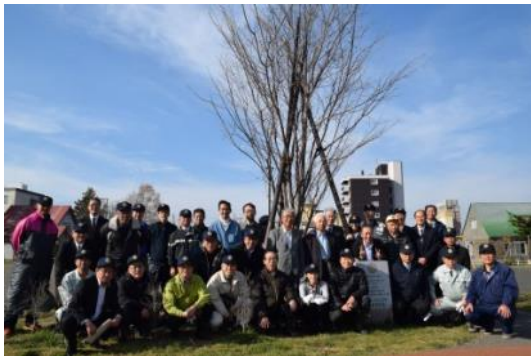
桜の記念樹をバックに記念撮影

その後、2510地区の補助金事業として桜の木の植樹をグリーンベルトの千歳川河川敷（東雲町3丁目 ポエム広場）に植える作業を行いました。