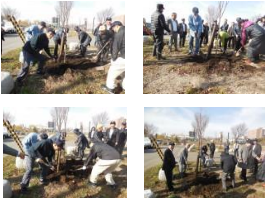
なれないスコップさばきで植樹の作業