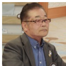
ロータリー情報・定款細則委員会より提案