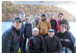
※華麗にトランペットを披露する大西会長、参加した10名全員で集合写真